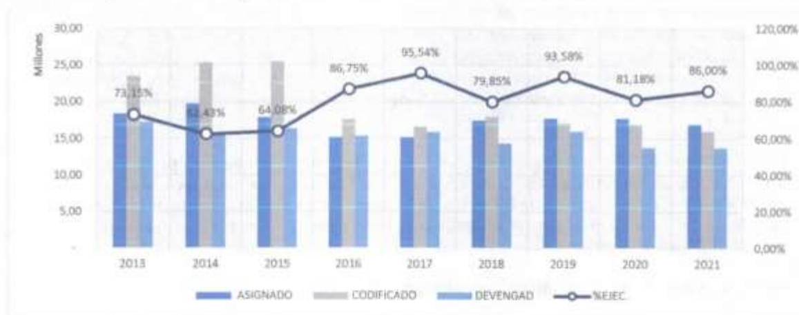
Gráfico 1: Ejecución Presupuestaria Anual

Elaboración: Dirección de Planeamiento y Aseguramiento de la Calidad