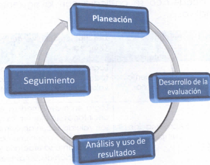
FIGURA 1. ETAPAS DEL PROCESO DE EVALUACIÓN DE DESEMPEÑO DE DOCENTES